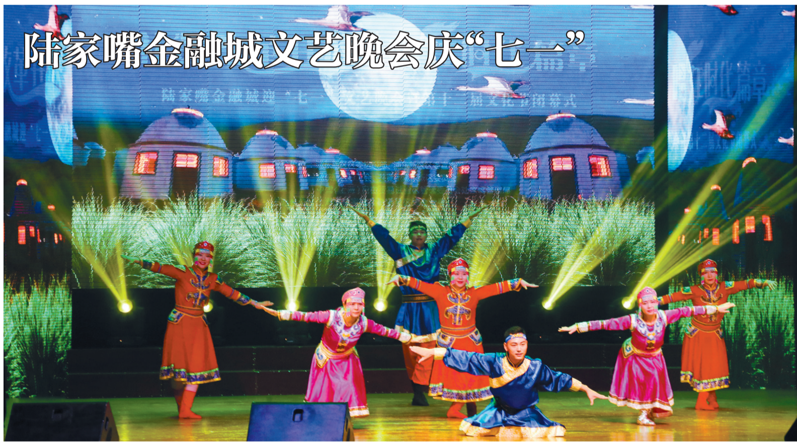
金融城白领表演精彩的文艺节目庆祝党的生日。

本报讯(记者 张淑贤)管弦乐合奏《红旗颂》、配乐朗诵《红船,从这里起航》、情景讲述《梦缘陆家嘴》、歌舞表演《共筑中国梦》……6月30日晚,由陆家嘴金融贸易区综合党委、综合团工委主办的“陆家嘴金融城迎七一文艺晚会”在浦东新舞台举行,金融城白领们表演了精