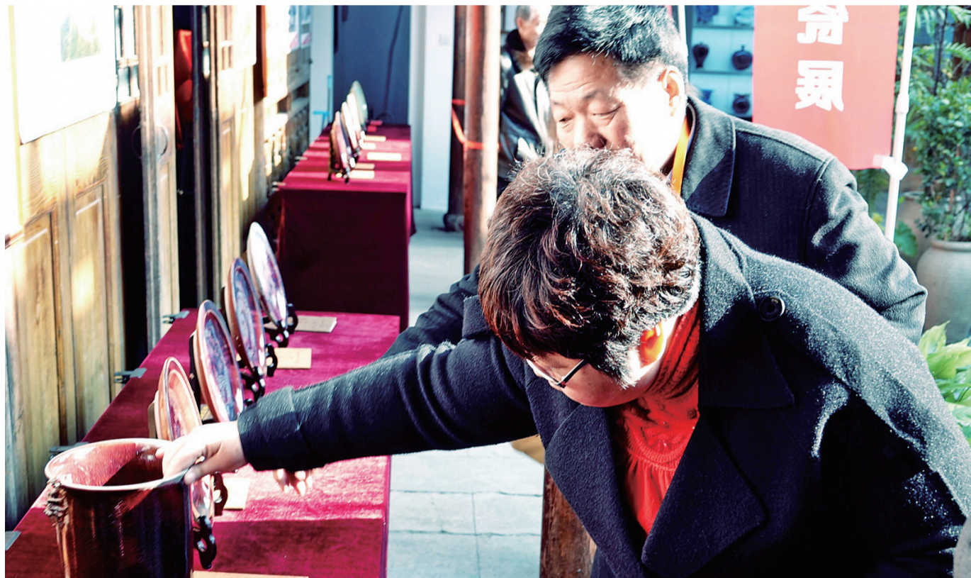
观众在欣赏钧瓷展上的钧瓷精品。

申港社区还将建立和完善以遵纪守法、孝亲敬老、邻里互助、遵守公约、信守承诺等为主要内容的家庭“诚信档案”,作为其参与经济建设和社会活动的信用凭证,并探索建立诚信奖惩机制,将“诚信”打造成为申港社区的一张名片。