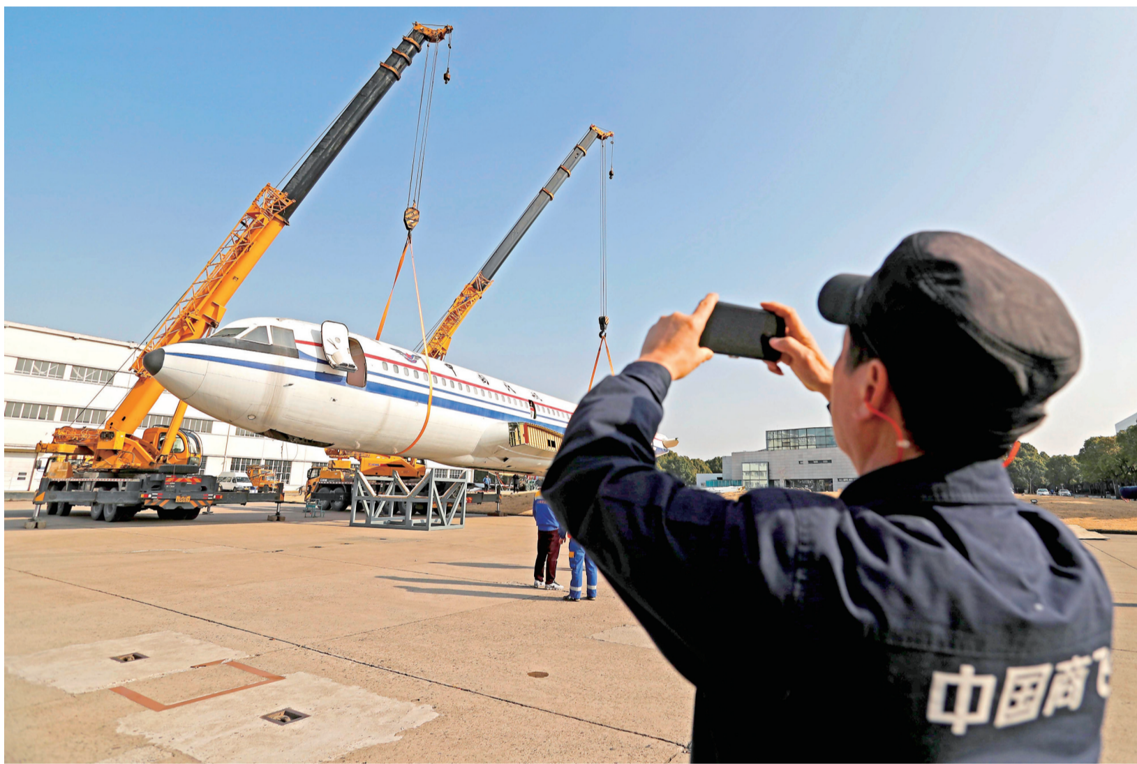
12月25日,运-10穿越大半个上海,来到了浦东的“新家”。