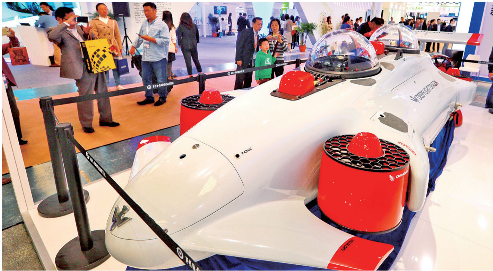
上海彩虹鱼海洋科技股份有限公司带来一款水下飞行潜艇,展示了来自浦东企业的“黑科技”。